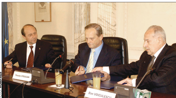
(15 octombrie 2003, Palatul Parlamentului)

Co-președinții Alianței D.A. PNL-PD, Theodor Stolojan și Traian Bănescu, semnează împreună cu liderul PUR Dan Voiculescu, alias „Felix Motanu”, un Protocol de colaborare privind desfășurarea referendumului pentru revizuirea Constituției. Cei trei lideri au declarat că acțiunea lor este menită să prevină fraudarea votului de către PSD. ■ (O.B.)