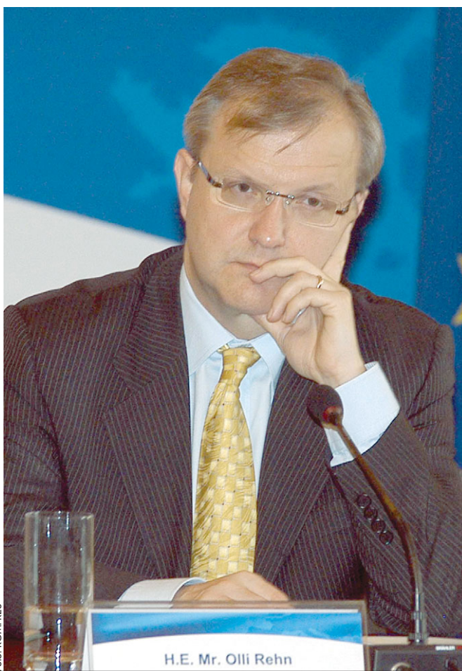
H.E. Mr. Olli Rehn