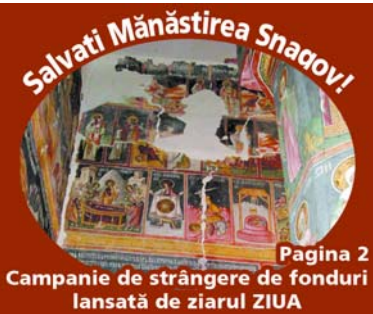
Pagina 2 Campanie de strângere de fonduri lansată de ziarul ZIUA